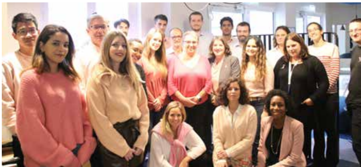
Les collaborateurs de KERIALIS vêtus de rose pour soutenir la cause Octobre Rose.

KERIALIS est également partenaire de la plateforme Vendredi et offre à ses collaborateurs la possibilité de s'engager sur son temps de travail pour des associations qui répondent à des enjeux sociétaux ou environnementaux.